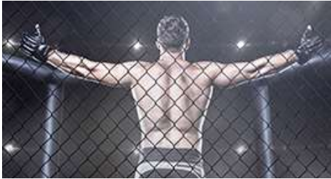
CIRCUITO NACIONAL DE MMA AMADOR