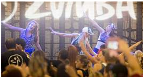
ESTAÇÃO VIDA STRONG BY ZUMBA®