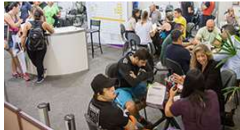
PRAÇA GESTÃO BY MICRO UNIVERSITY